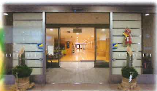
マッシーテラス数年ぶりに角松でお正月を迎えました。