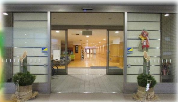
マッシーテラス数年ぶりに角松でお正月を迎えました。